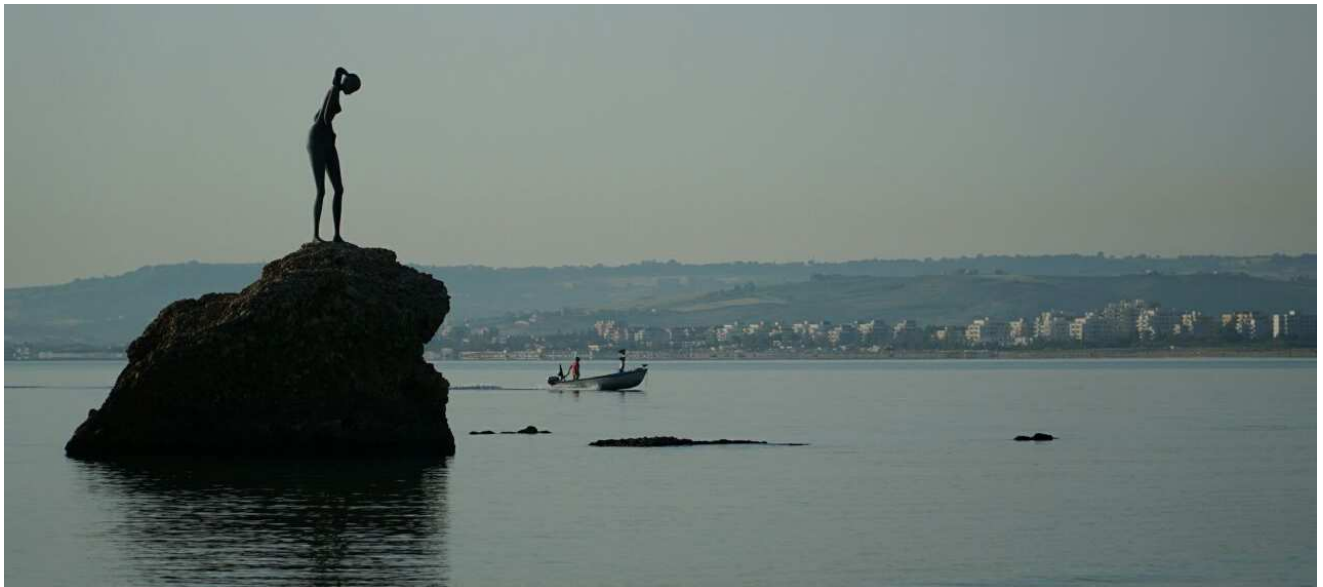
Lo scoglio della sirenetta, con il monumento della Bagnante, uno dei simboli della città vastese