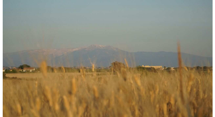
Vista della Majella da Punta Aderci

La leggenda vuole che sia stato l'eroe greco Diomede nel 1170 a. C. a fondare la città.